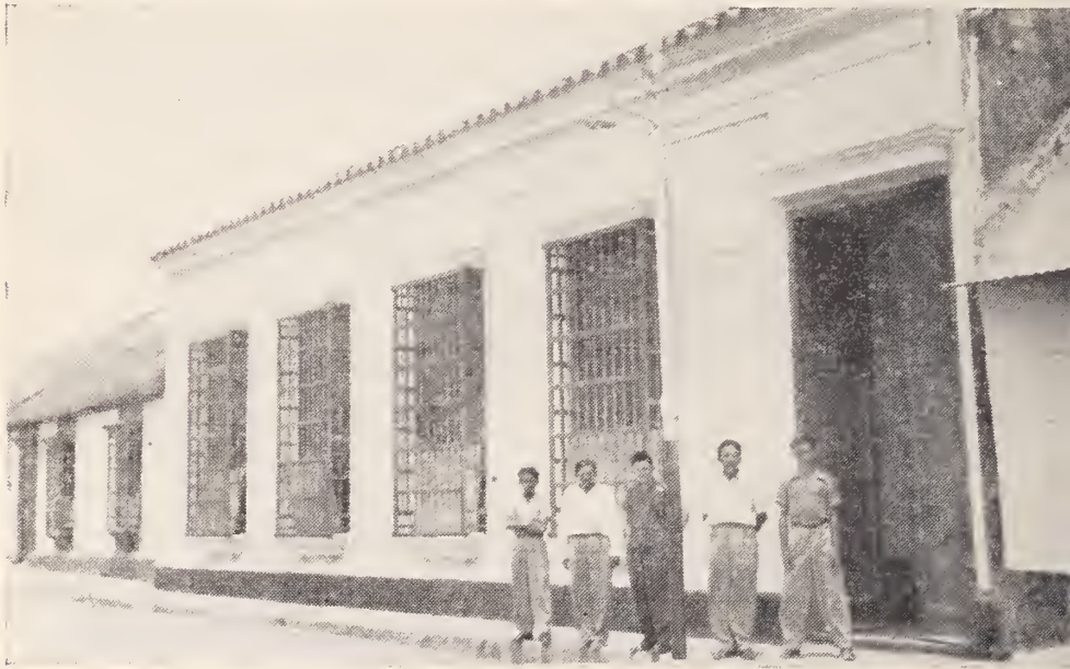
Sinamaica.—Fachada de la Casa-Colegio de las Hermanas Misioneras de María Inmaculada.

gresivamente y que aumentará con el tiempo conforme vayan conociendo la utilidad y facilidad de la enseñanza.